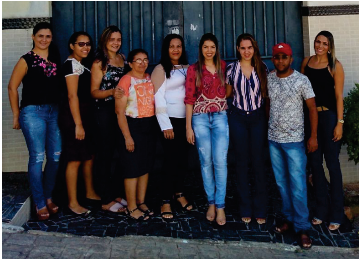
Equipe - CRAS III - Nossa Senhora do Perpétuo Socorro