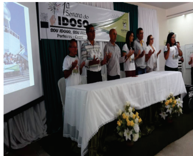
1º SEMANA DO IDOSO