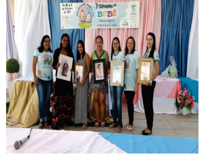
SEMANA DO BEBÊ