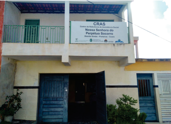
CRAS III - Nossa Senhora do Perpétuo Socorro Distrito Simão - Porteiras - CE