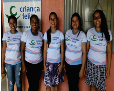
EQUIPE DO PROGRAMA CRIANÇA FELIZ