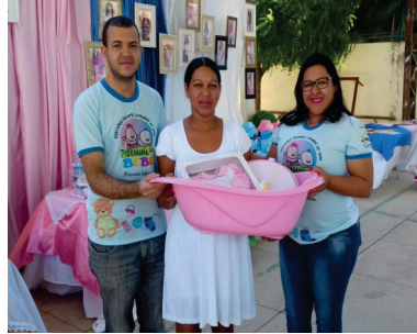
ENTREGA DE KIT BEBÊ BENEFÍCIO EVENTUAL