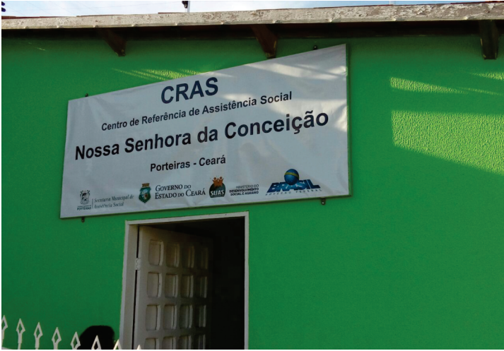
CRAS I - Nossa Senhora da Conceição Rua Campo Santo, 38, Bairro Campo Santo – Porteiras - CE