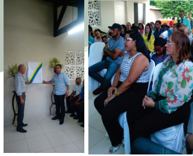
INAGURAÇÃO DO CRAS I - NOSSA SENHORA DA CONCEIÇÃO