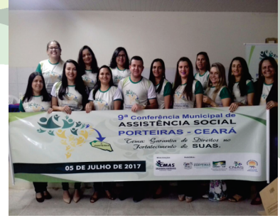
CONFERÊNCIA MUNICIPAL DE ASSISTÊNCIA SOCIAL