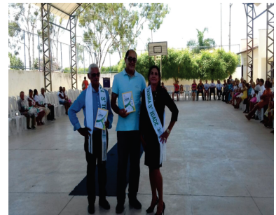
REI E RAINHA DA MELHOR IDADE