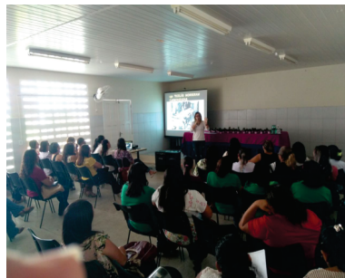
PALESTRA DIA INTERNACIONAL DA MULHER