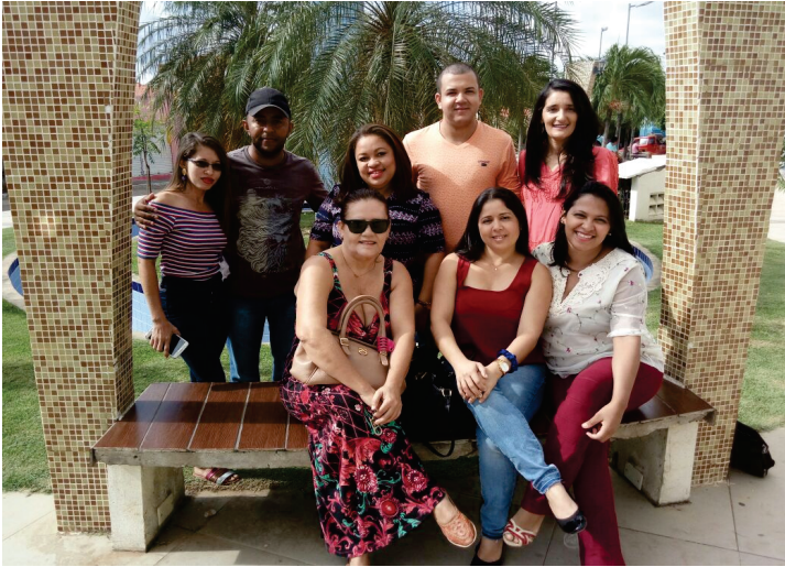
Equipe - CRAS I - Nossa Senhora da Conceição