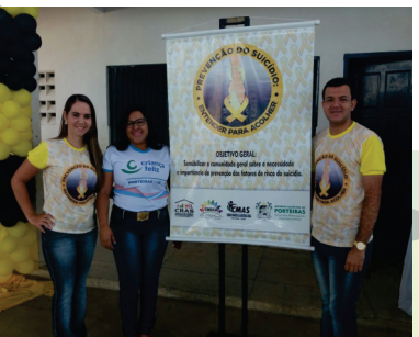
LANÇAMENTO DO PROJETO MUNICIPAL DE PREVENÇÃO DO SUICÍDIO