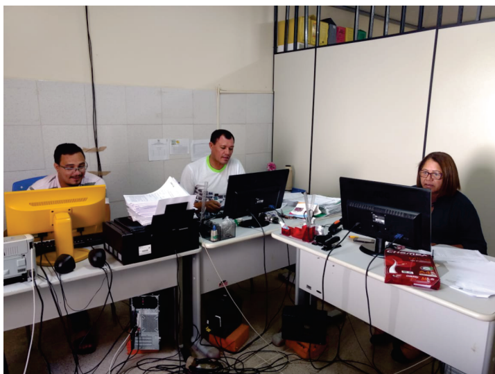
Equipe do Cadastro Único

O Cadastro Único para Programas Sociais do Governo Federal (Cadastro Único) é uma ferramenta de identificação e seleção de famílias de baixa renda para inclusão em ações e programas sociais.