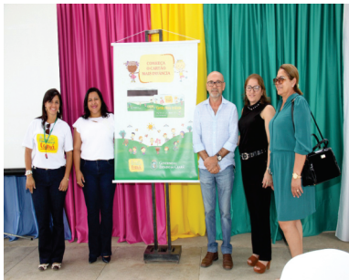
LANÇAMENTO CARTÃO MAIS INFÂNCIA