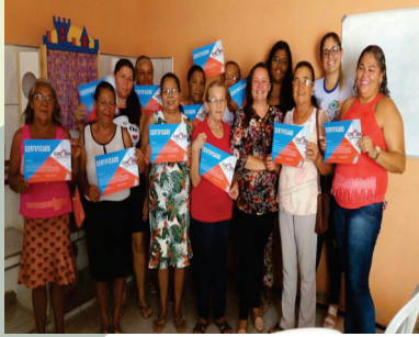
CURSOS PARA AS FAMÍLIAS