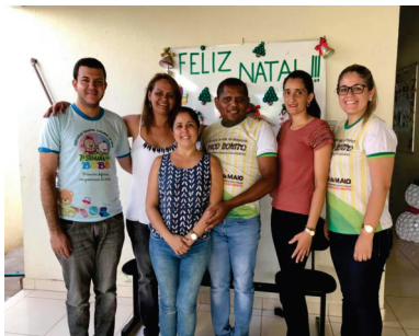
MONITORAMENTO MUNICIPAL NOS CRAS