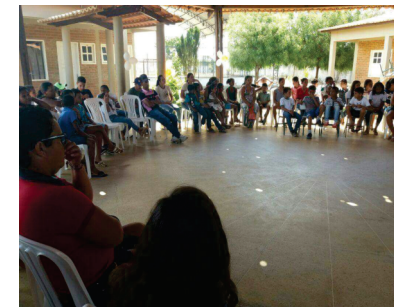
AÇÃO DO CRAS NA ZONA RURAL