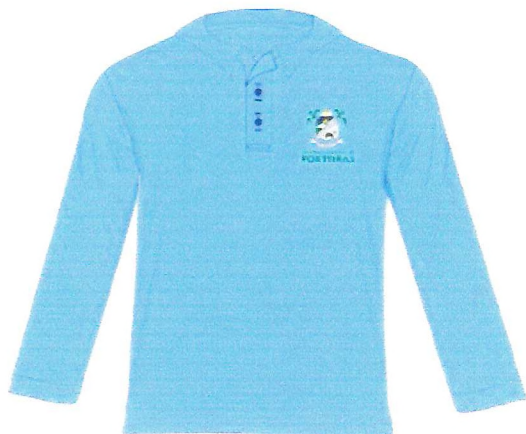
AGENTE DE SAÚDE MANGA LONGA