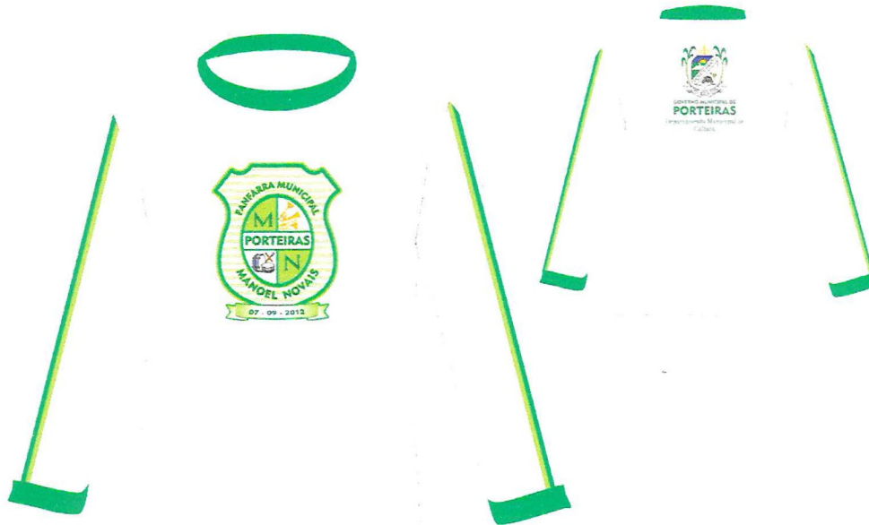
TABELA DIMENSÕES CAMISA MASCULINA MANGA LONGA*