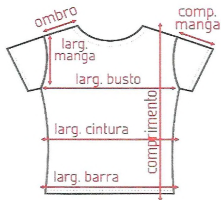
TABELA DIMENSÕES CAMISA MASCULINA MANGA CURTA*