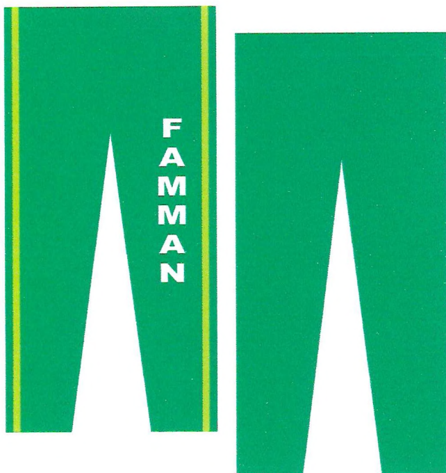
TABELA DIMENSÕES CALÇAS*