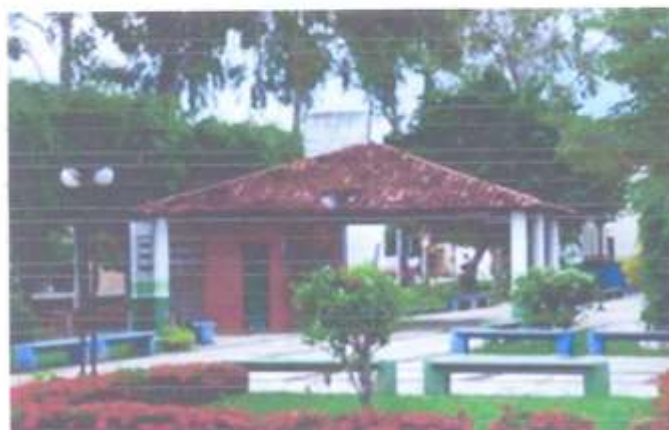
01 Churrascaria (5x5m)