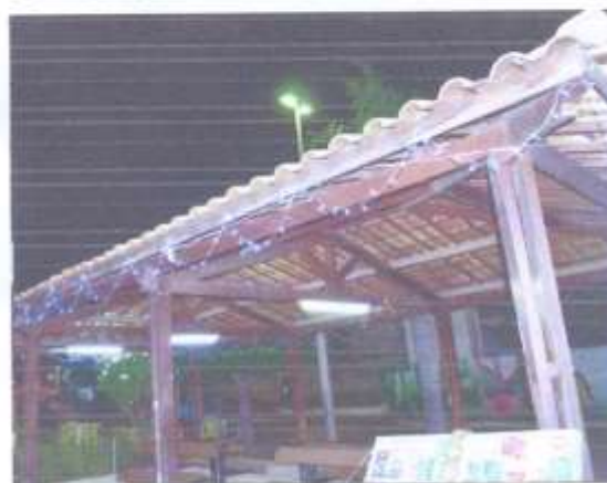
02 guaritas (5x3m e 3x2m)

02.2 - Revestir dos dois lados o monumento tridimensional da Praça da Liberdade com mangueira de led, Dimensão (AxLxP): 300 x 120 x 20 cm