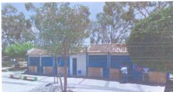
06 quiosques (3m cada) = 18m

02.1 - Decoração das áreas cobertas contornadas com lâmpadas led.